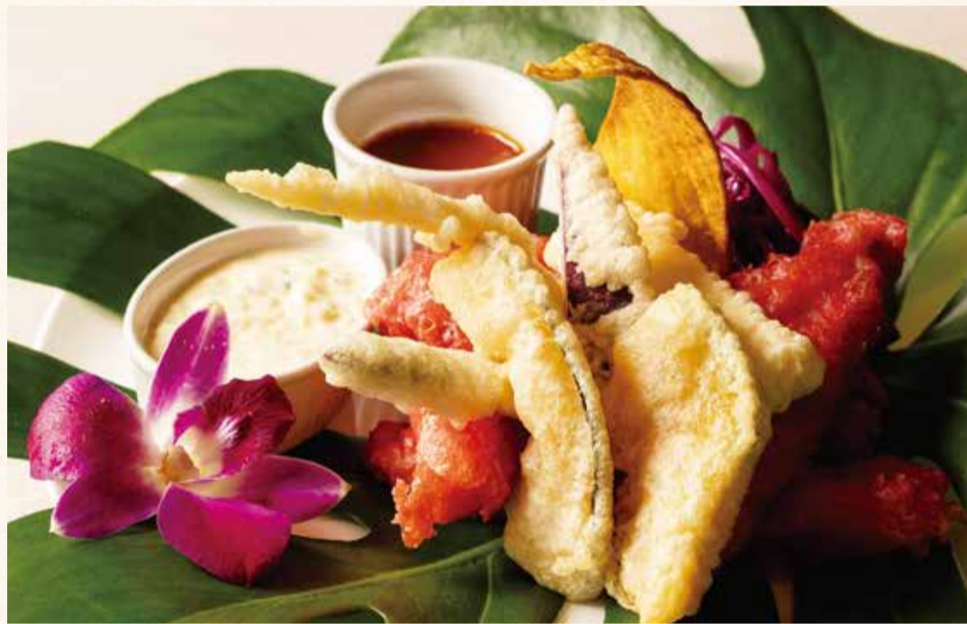
マヒマヒのフリット