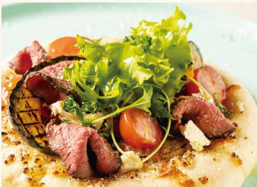
ローストビーフサラダ