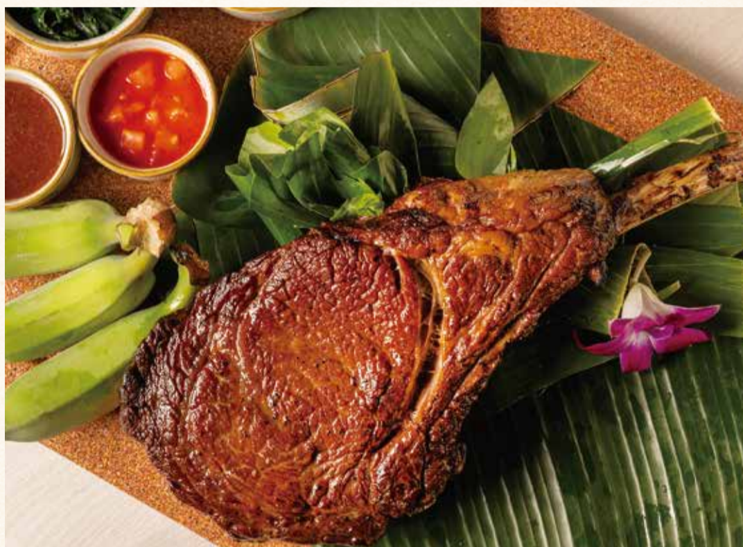
トマホークのロースト (4~7名) ¥35,000