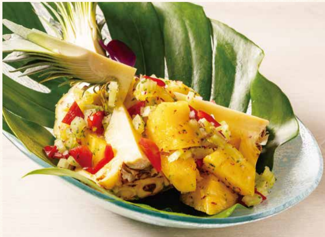
フレッシュパインのサルサマリネ(2~3名様)