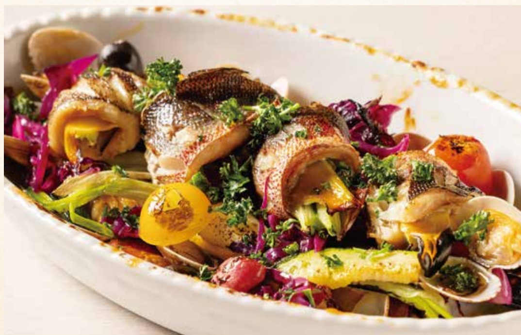
鮮魚のココット オーブン焼き