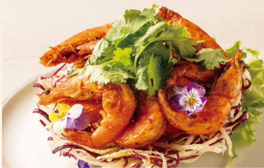
ソフトシェルのガーリックシュリンプ