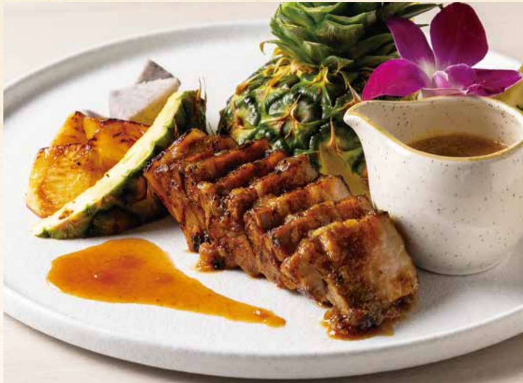
ポークバラ肉のロースト パインエスニックソース ¥4,500