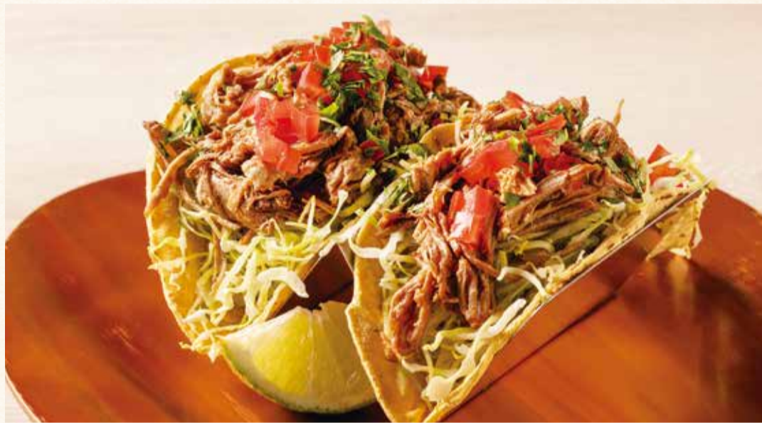
ブルドポーク BBQソース