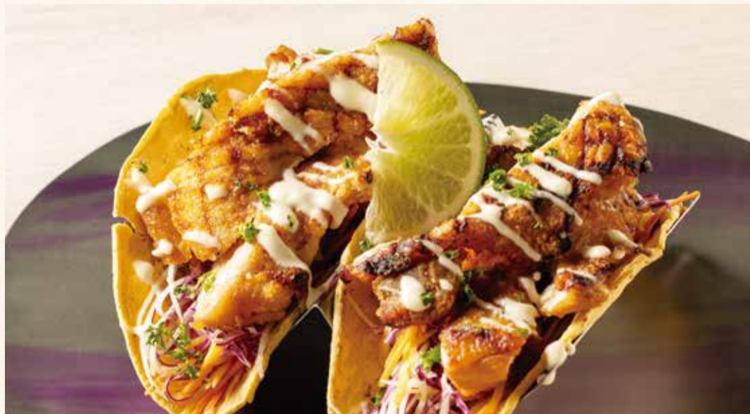
ヨーグルト風味のやんばる鶏